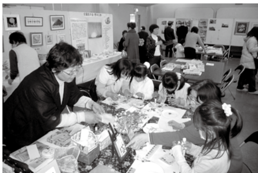
アメリカンフラワーを体験中