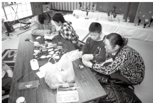
お手玉づくりに挑戦！！