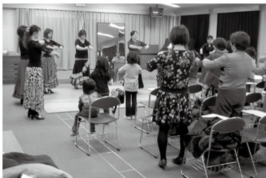
フラメンコを体験中