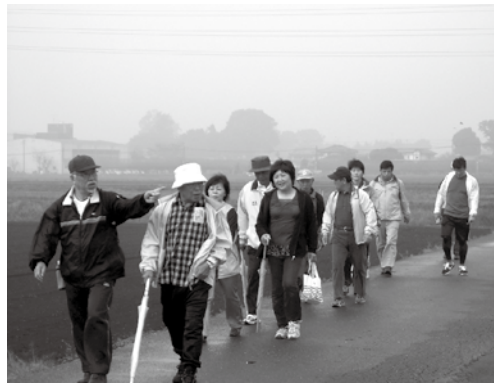
曇り空だったけど…