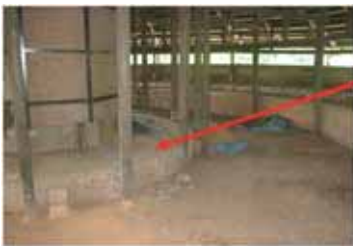
煉瓦窯一階 この下が集煙道