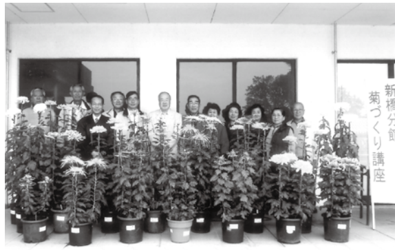
菊づくり講座成果 文化祭出展