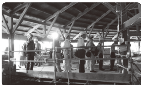
煉瓦窯内2階でのガイド