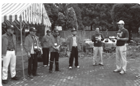
ガイドメンバーのミーティング

7月21・22日、両日煉瓦窯の特別公開が開催されました。両日とも朝は「ホッポツ」と雨の降る天候でしたが、約1300名の来場者がありました。煉瓦窯を案内させていただいたのは、今年度で2回目となる「ボランティアガイド養成講座」を受講したメンバーです。事前に「ボランティアガイドの心得」、煉瓦窯の「生い立ち」や「修復工事の内容」の勉強を済ませて、特別公開日をむかえました。おおよそ15名をグループにして、2日間では約800名超える見学者をご案内させて頂きました。煉瓦窯は修復工事の途中ですので、一部ご案内出来ない部分もありましたが、現地工事会社のご協力により、事故を起こすことも無くご来場者を案内することができました。みなさんお疲れ様でした。