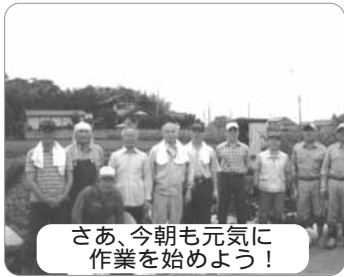
さあ、今朝も元気に作業を始めよう！

なっていると聞いています。その他活動は新橋祭りへの出店、「秋の芋掘り」と「年末の餅つき」各大会には、地域の子供たちも多数参加して盛大に行われており、さらに有志によるゴルフコンペや秋は一泊旅行など多彩な行事があります。