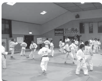
野木町柔道クラブの練習風景