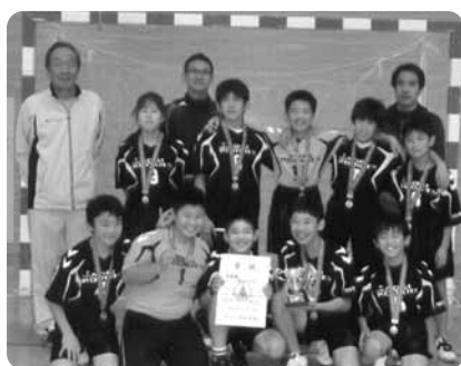
野木JHCルーキーズの皆さん

思います。(窓口健康福祉課) スポーツでは、最近、特に大きなニュースがあります。少年少女部門ハンドボール大会で野木JHCルーキーズが県代表として関東大会に出場、又、全国少年柔道大会ベスト16達成等の快挙です。未来の野木町に夢と希望をあたえてくれる若者達から目を離せません。