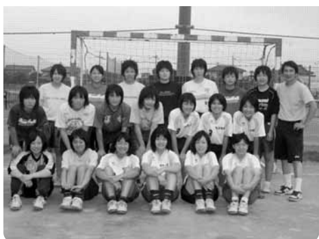
栃木商業高校女子ハンドボール部の皆さん

全国高等学校総合体育大会ハンドボール競技大会は、7月29日～8月3日、岩手県花巻市総合体育館で行われます。