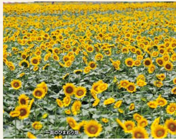
一面のひまわり畑