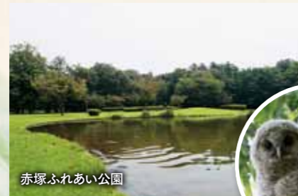
赤塚ふれあい公園