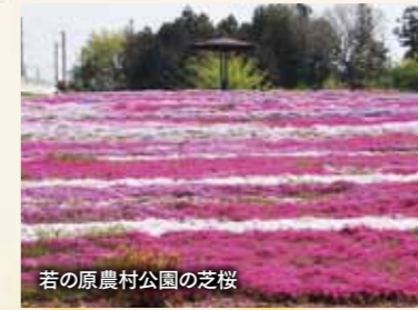
若の原農村公園の芝桜