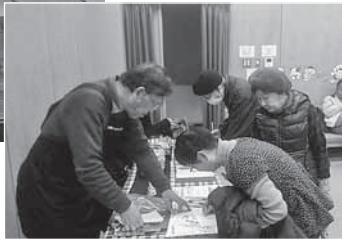
音楽サロンの受付

本好きな人を多くする、本の世界を広くすることを中心として、くつろいだ雰囲気好きな本やおすすめしたい本などを話し合う読書サロンを開いています。また「ひまわり真空管クラ