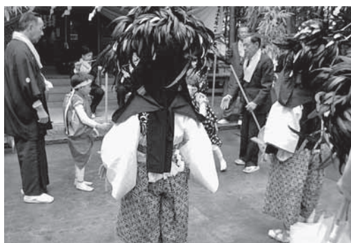
棒式の舞と獅子舞

午後2時、仮舎で神官の祝詞と大勢の人の見守る中、棒式の舞と獅子舞を舞った後、当番耕地の寺山の山車を先頭に、笛と太鼓の祭囃子と共に、新田、上宿、下宿、細谷の山車に続き、ご神体の神輿渡御が始まります。コースは、ささら発祥の野渡地区の上宿下宿細谷寺山新田を巡り、耕地境では、神輿や宝剣等の担ぎ手が入り替わり、約3時間に回り練り歩き、最後に熊野神社本殿前で、棒式の舞の神童子の「エン、エン」「ヤー」と云う元気な声が杉木立に響き回ります。そして次の獅子舞と共に、熊野神社本殿に奉納されました。