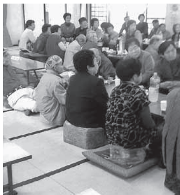
余興を見ながら楽しみました

4月になってから気温の寒暖差や花粉の飛散などにより体調をくずしがちになる日もありますが、当日は満開の桜を鑑賞しながら、皆様との親睦を深めることができました。