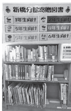
新橋小学校内 寄贈図書

新橋学区分館では、新橋小学校の図書室に新橋分館文庫コーナーを設置していただき、毎月3冊の本を、寄贈させて頂いております。今年で4年目となりますが、コーナーには学年毎に果物の絵を付けております。例えば1年生の本には「サクランボ」、3年生の本には「みかん」というように分かり易く分類されております。分館文庫コーナーには、数十冊の本が並んでいます。児童の皆さんも大変喜んでおられるこの事です。本の選定は、図書室の司書の方にお任せしております。 新橋学区分館では、このような分館文庫の他にも、地域学区