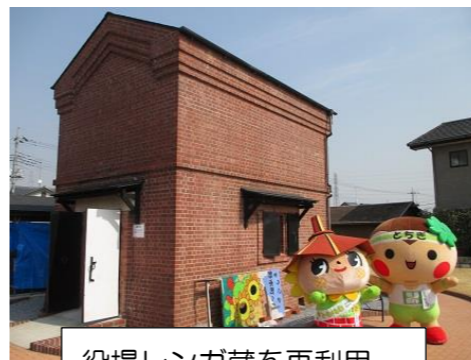
役場レンガ蔵を再利用

野木町ボランティア支援センター「きらり館」は、町民の自発的なボランティア活動や社会貢献活動の推進策を実施するための拠点として、平成23年（2011年）6月にオープンしました。早いもので今年10周年を迎えます。