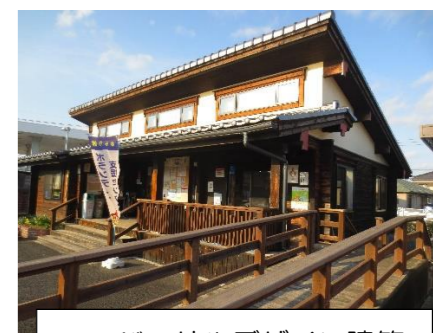
ユニバーサルデザイン建築