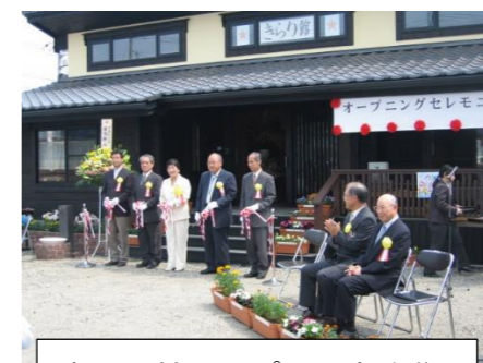
きらり館オープン記念式典