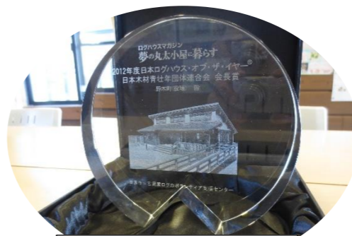
受賞記念クリスタル盾

ログ材に国産スギを使い、落ち着いた和風の建物になっています。国産材の積極的な使用と町並みに溶け込むデザイン性の高さ、木材建築の中でも特殊といえる構造をもつログハウスでの公共施設建