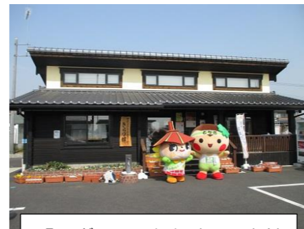
「のぎのん・とちまる」来館