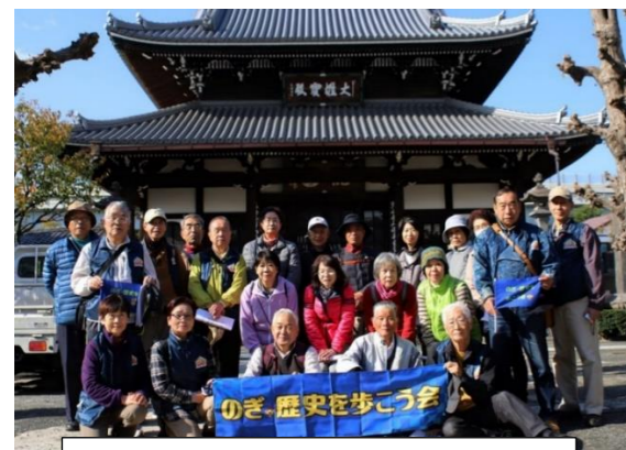
のぎ・歴史を歩こう会のみなさん