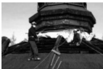
←写真3 煙突と屋根の 接合部分