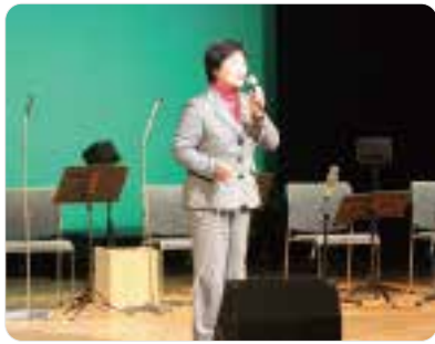
収録前に挨拶をする 真瀬宏子町長

収録の内容は、NHKラジオ第1、NHK-FM、国際放送で、4月6日(土)、13日(土)、20日(土)午後0時30分〜0時55分に放送される予定です。