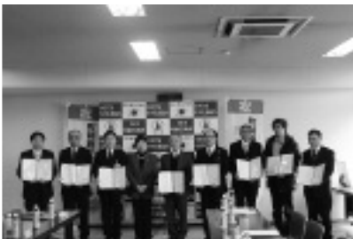
真瀬町長と協力事業所の皆さん

協定事業所は、(有)読売センター野木、(有)土子新聞店、ASA野木、古河ヤクルト販売株(社)栃木県エルピーガス協会小山支部、東京電力(株)栃木南支社、とちぎコープ生活協同組合、ヤマト運輸(株)栃木主管支店、ASA古河です。 (敬称略、順不同)