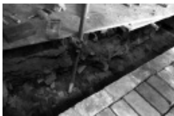
写真2→ 7号窯外壁内部