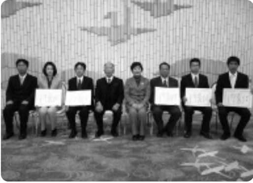
真瀬町長と表彰を受けた皆さん