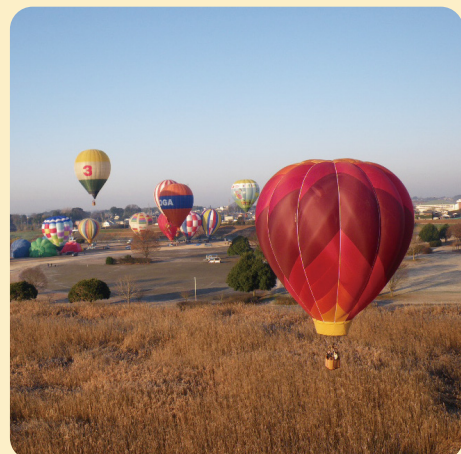
渡良瀬遊水地周辺の交流促進