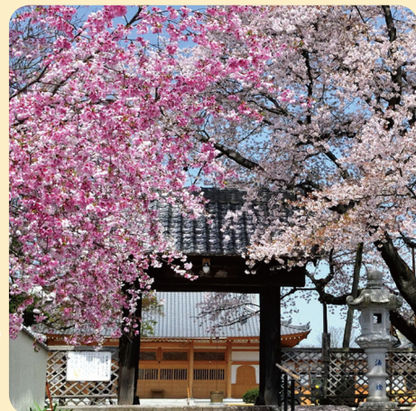
地域の魅力を発信する