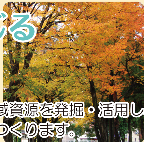
地域資源の魅力を引き出す