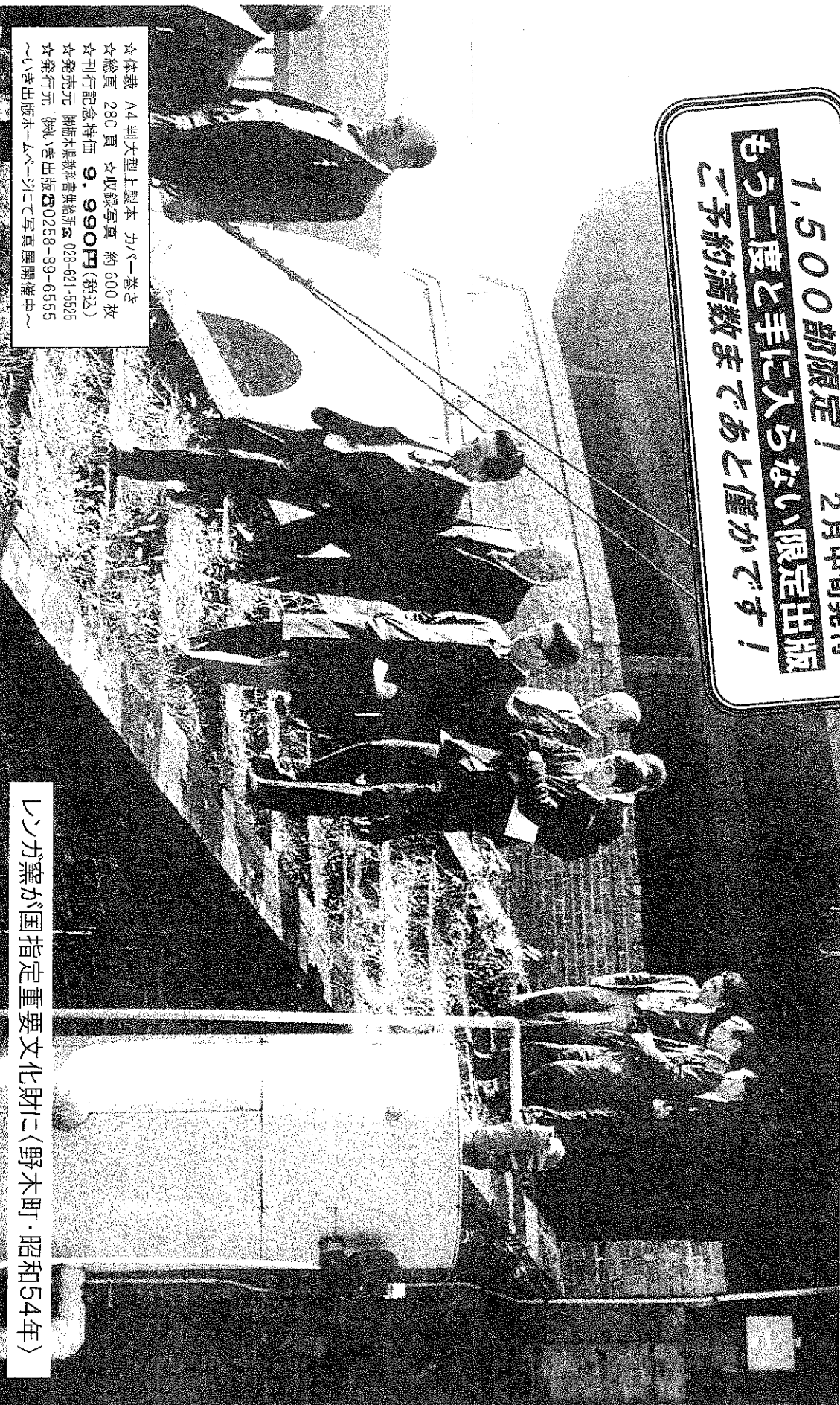
リンガ寮が国指定重要文化財に(野木町・昭和54年)

1,500部限定！ 2月中旬発売刊 もう二度と手に入らない限定出版 ご予約満数まであと僅かです！