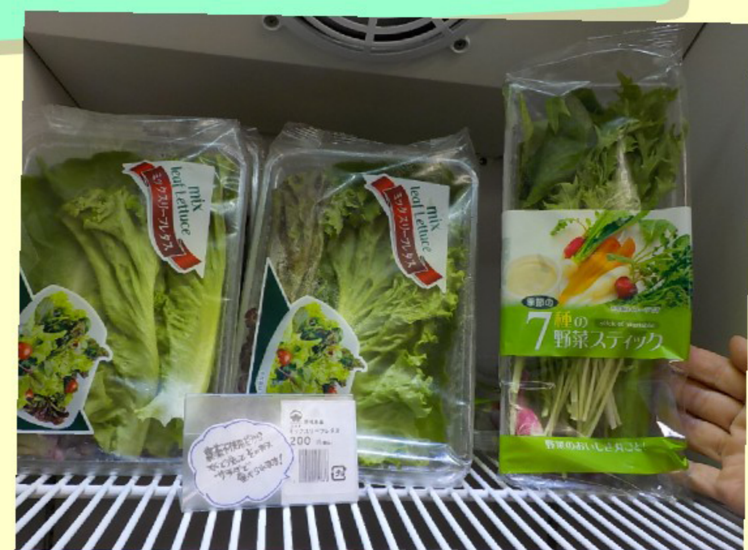
右側の"7つの野菜スティック"は、 入っている野菜が季節などで違い、 いつでも楽しめるオススメ商品♪