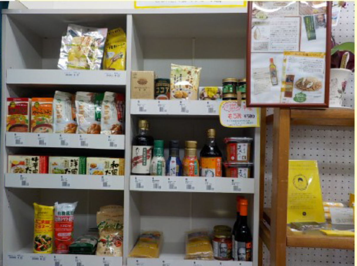
調味料もそろいます