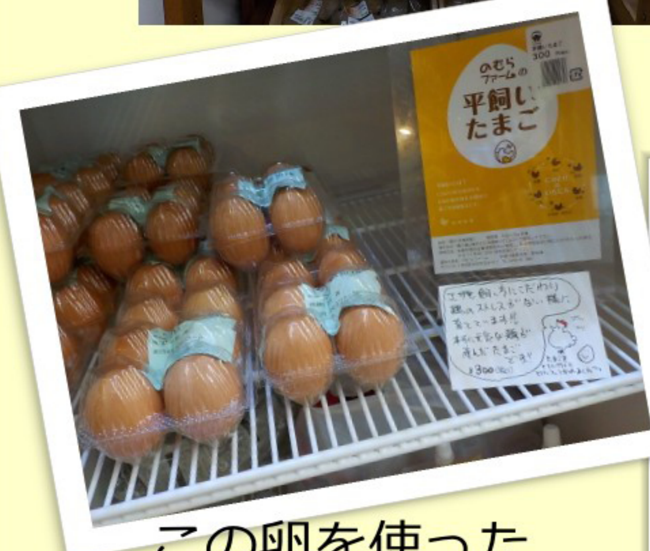
この卵を使った おやつもありました