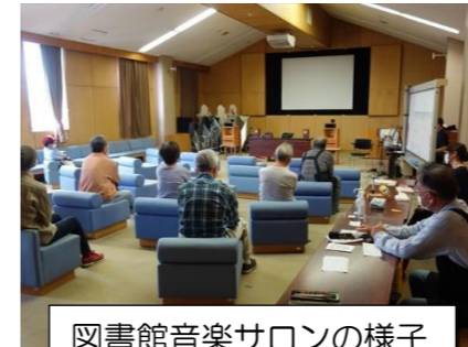
図書館音楽サロンの様子