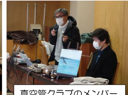
真空管クラブのメンバー

音楽会（通称「図書館音楽サロン」）は、読書のまちづくりのみなさまと共催で行っています。総勢5名のメンバーで偶数月に、図書館2階のホールで開催しています。音楽サロンの大半は、参加者のお気に入りのCD、レコード、USBメモリー、スマホ、音楽DVDを持参していただき、その音源を、真空管アンプを通してスピーカーから流すという方法をとっています。