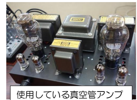
使用している真空管アンプ

さて、当クラブは機材のほうで協力させていただいていますが、機材の大きな特徴は、増幅素子として真空管を用いることで、シンプルに構成できている点にあります。シンプルイズベストです。そうすることで、本来LPやCDに包まれている感動的な生の歌や演奏の品位を落とさず、ありのまま再現できるのではないかと考えているからです。機材につきましては、これからはシンプル化を進め本来、身近なLP・CDに包まれている生歌、生演奏の再現を目指し、参加者のみなさまと感動を共有したいと考えています。