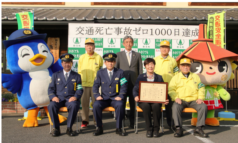
問 総務課 ☎(57)4112

また、感謝状贈呈後、警察や交通安全協会など交通安全に関する団体の方々約70名が参加し、春の交通安全町民総ぐるみ運動の事業として街頭啓発活動も行われました。