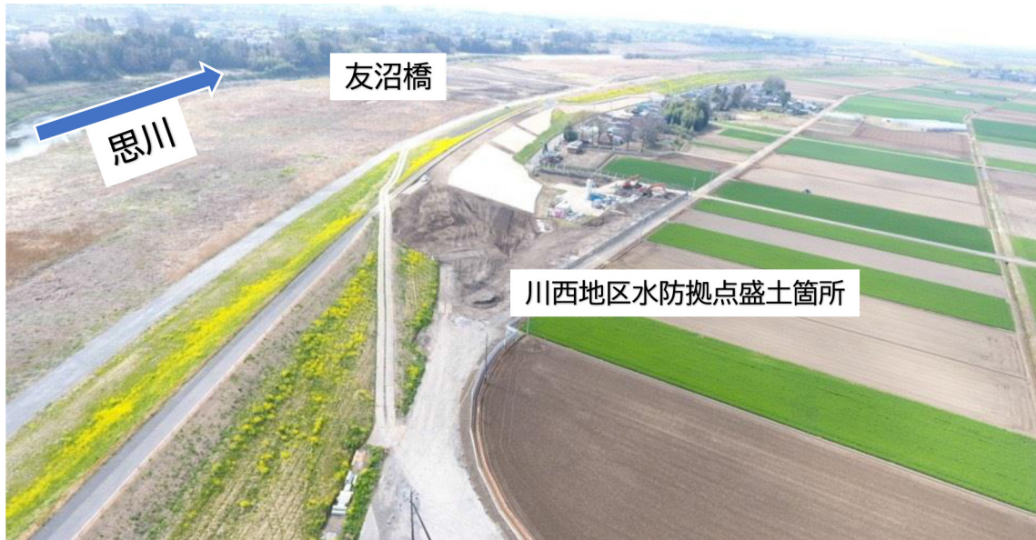
▲川西地区水防拠点整備事業の盛土工等の施工状況 3月末日友沼橋北側上空からの撮影

現在、川西地区で行われている水防拠点整備事業は、洪水被害を最小限とし、災害時の緊急復旧活動を行う上で必要な土などの整備を行うとともに、災害時の活動拠点となるなど有効な施設です。