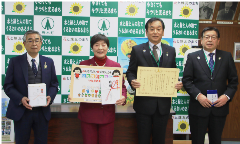
問 小こども教育課 ☎(57)4183

また、ランチヨンマットは「栃木県産農畜産物をたくさん食べて健やかに成長してほしい」という願いからご寄贈いただきましたので、これからも学校給食を通じて地産地消や食育推進を図ってまいります。ありがとうございました。