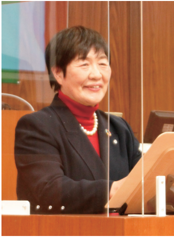
野木町長 真瀬宏子

町づくりの基本理念を「やさしさとやすらぎに満ちた明るいまち」と位置づけ、人々が和やかに、明るく、町民それぞれの幸福感が増していくようなまちづくりを目指して、各施策の実現に、力を尽くしてまいります。