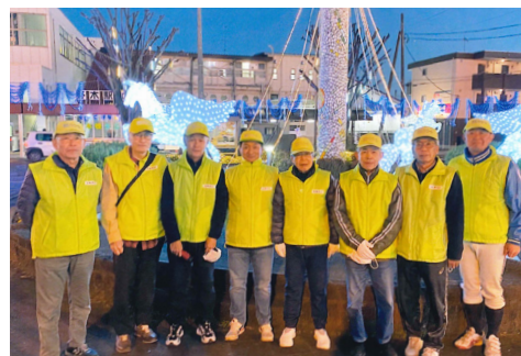
写真: 駅前イルミネーション

私たち丸林西区では区三役及び自治会長9名で、毎月第4日曜日に防犯パトロールを行っております。夏の期間は午後6時、冬の期間は午後5時から3編成で実施しております。管内には丸林中央公園をはじめ、富士見公園や馬場公園などあり、生活環境は恵まれていると感じております。時には公園で夕方遅くまで遊んでいる子供たちには、早く帰宅するよう声掛けをしています。特に最近では全国的にも小学生が狙われる事件が多発しておりますので、防犯パトロールは特に重要な活動だと思っております。この取り組みは、平成30年度からはじめて約5年になりますが、幸い西区におきましては、事件等の発生はしておりません。今後とも私たちは地域の皆様が、安全・安心に暮らせる街を目指して、防犯パトロールは続けて行きたいと考えております。