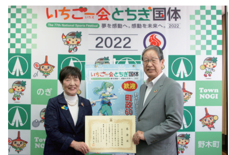
問いちご一会とちぎ国体野木町実行委員会事務局(町生涯学習課内) ☎(57) 4258

いちご一会とちぎ国体野木町実行委員会では、引き続き協賛の募集を行っております。詳細は問合せ先までご連絡ください。