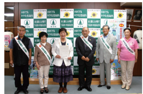
問健康福祉課 ☎(57) 4196

このメッセージは、犯罪や非行のない地域を築くために罪を犯した人たちの更生について全ての国民に理解と協力をお願いするものです。式後、野木駅や町内スーパーなど3箇所に分かれて街頭啓発活動を行いました。