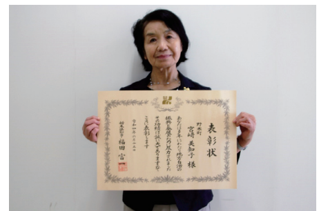
問議会事務局 ☎(57) 4106