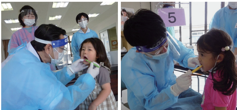
問健康福祉課 ☎(57) 4171