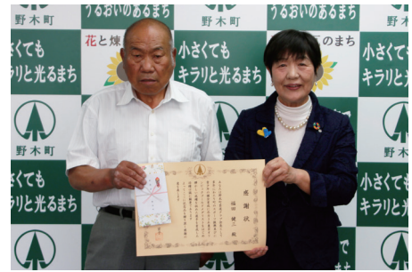
問生涯学習課 ☎(57) 4179

その功績を讃え、町長より感謝状を贈呈しました。今後とも、より一層のご活躍を期待しております。