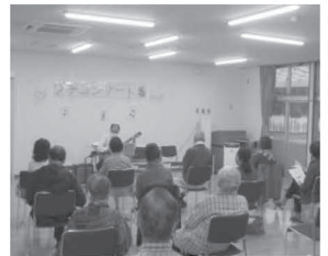
コンサートのようす