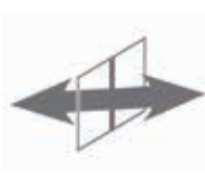
通風・換気 通水・施錠