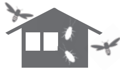
害虫・悪臭の発生