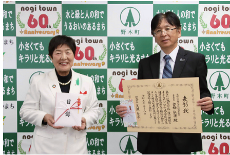
問政策課 ☎(57) 4116