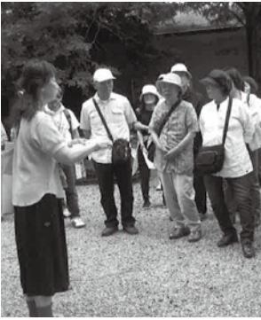
筑波実験植物園にて

5月28日に野渡コミュニティセンターを出発し、筑波山、筑波宇宙センター、筑波実験植物園の三ヶ所をめぐる、街歩きウォーキングに始めて参加しました。