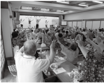
「劇団みなみ」と楽しむ