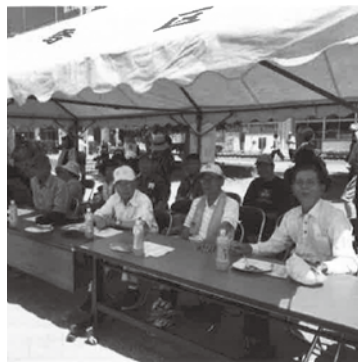
児童から元気をもろう招待者

「劇団みなみ」の皆様によるコント、手品、ダンスなどの公演に大笑いした後、恒例のカラオケや抽選会も行いました。抽選会では名前が呼ばれるたびに一言一憂していました。至らないところも多々ありましたが、参加者の方に大いに喜んで頂けたと思っています。