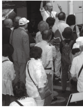
つくば宇宙センターにて