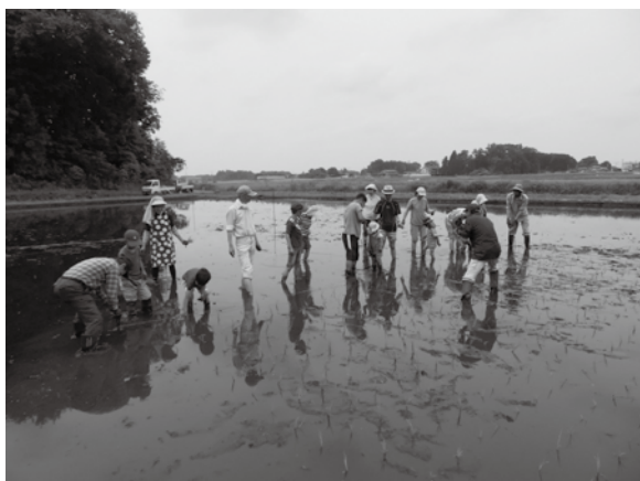
収穫が楽しみだね！