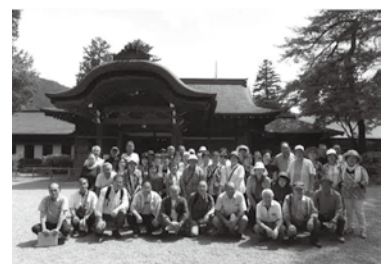
田母沢御用邸玄関前