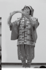
南京玉すだれの妙技

また今年には21名もの傘寿の方に益々のご健康とご多幸を願って、お祝いの品を贈呈しました。