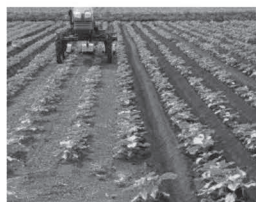
除草管理風景(当時)