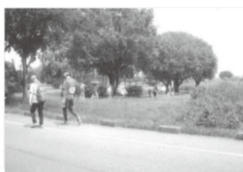
《ウォーキング日和！》