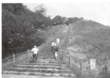
《頑張って登ります!》

昼食後バスで妻沼聖天山へ移動し、国宝の本堂や山門の素晴らしい彫刻の数々を案内人の方の説明で見学。感動いっぱいの有意義な一日でした。役員の方々に感謝。