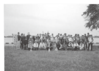
《池を背にパシャッ》