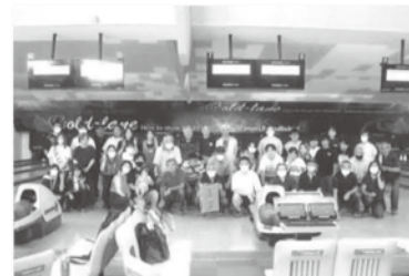
《楽しく過ごせました》