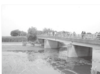
《橋を渡って・・・》