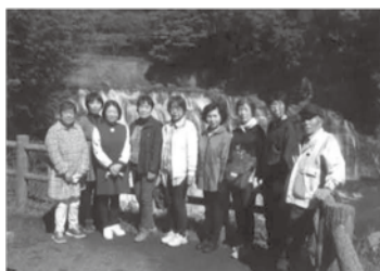
《滝の前で写真撮影》