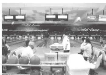
《目指せ、ハイスコア！》