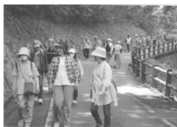
《楽しくお話しをしながら》