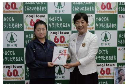
問 産業振興課 ☎(57)4238