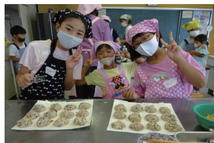
問 健康福祉課 ☎(57)4171

食生活改善推進委員会は「私達の健康は私達の手で」をスローガンに町民の皆様の健康づくりを応援するボランティアグループです。