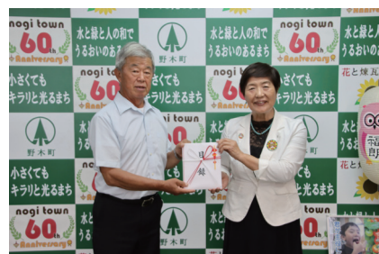
問 産業振興課 ☎(57)4238

お菓子等は、町内の保育園や児童館等へ、お米は生活困窮世帯への支援として使用されました。