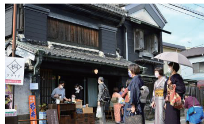
第14回きものday結城(2022年)の様子