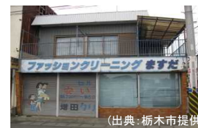
栃木県栃木市(空き店舗) 譲渡価額約240万円