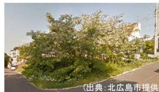
北海道北広島市(空き地) 譲渡価額約310万円