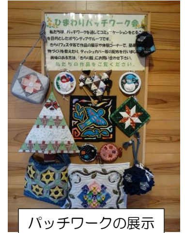
パッチワークの展示