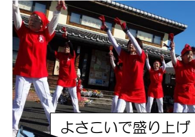
よさこいで盛り上げ