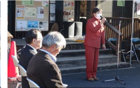
町長さんのあいさつ