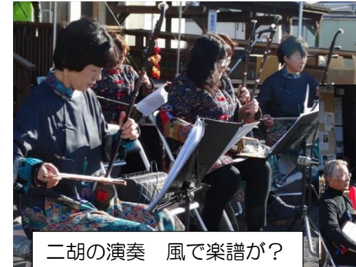
二胡の演奏 風で楽譜が？