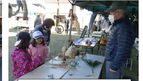
子供さんに大人気な竹細工