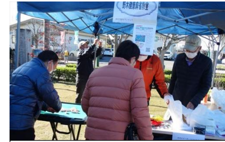
景品盛りだくさん健康麻雀教室

11月25日（土）に開催された「きらりフェスタ2023」（野木町ボランティア支援センター利用者協議会ときらり館で主催）の様子を写真でお伝えします。当日はきらり館に約300の方がおとすれました。