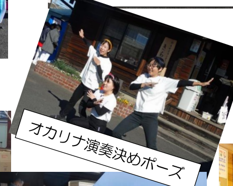
オカリナ演奏決めポーズ