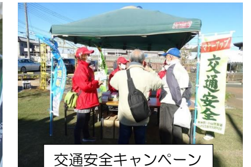
交通安全キャンペーン