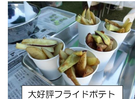
大好評フライドポテト