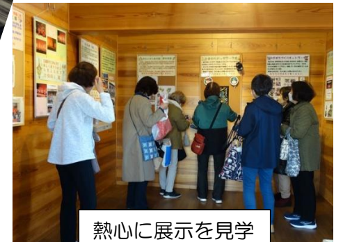
熱心に展示を見学