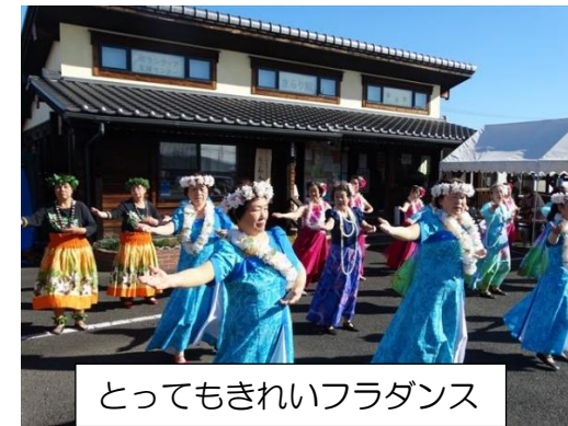
とってもきれいフラダンス