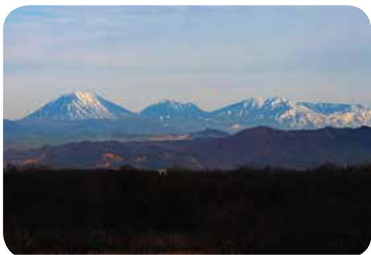
野渡グラウンド付近の土手から見える日光連山

このように寒い季節の中で一見何もないような野木町ですが、心持ちひとつで豊かな自然に気づかされ、触れることができるのは、とても幸せな環境であると思えました。ITやパソコンに疲れたら、少し周囲の自然に目を向けてみると、きつと勇氣と力をもらえらると思えます。