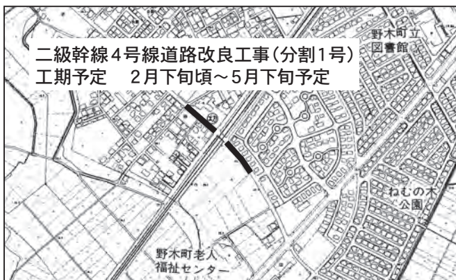
二級幹線4号線道路改良工事(分割1号) 工期予定 2月下旬頃～5月下旬予定

第一松原踏切周辺部の道路工事をを行います。工事期間中はご迷惑をおかけいたしますが、協力くださいますようお願いいたします。なお、踏切の改良工事は別途実施する予定です。ご理解の程、よろしく申し上げます。