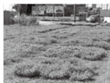
国道4号線野木交差点付近