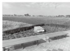
エニスホール東側