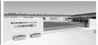
ひまわり館の写真

総合サポートセンターは、健康・福祉・障がい・生活困窮などの相談窓口です。心配なこと、不安なこと、困ったことなどは、一人で悩まずにご相談ください。