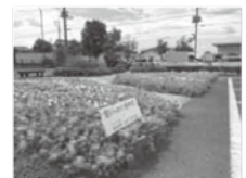
ボランティア支援センター