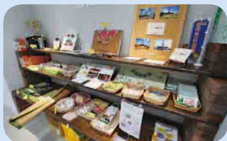
煉瓦窯のポストカードなど、ここでしか手に入らないものも...