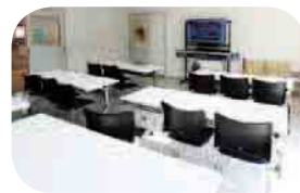
↑ 研修室 1

サークル活動や作品の発表、企画展、各種催事などにホフマン館の施設をご利用いただけます。詳しくはお問い合わせください。