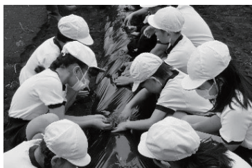
ジュース用のトマト 凛々子の苗植え (初挑戦)

今年もJAおやまのぎ松原大橋直売所にてミニトマト販売します。ぜひ、買ってください。