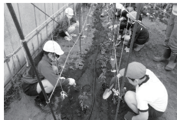
アイコの苗を植えました (6年目)

今年もJAおやまのぎ松原大橋直売所にてミニトマト販売します。ぜひ、買ってください。