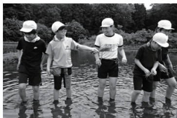
3～6年生の田植え 地域の方の田んぼで田植えをしました。