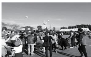
佐川野っ子ふれあい大運動会

令和7年6月7日(土)は、150周年記念【訓蒙館祭】を開催します。ぜひ、来てください。