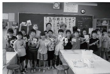
プレ訓蒙館祭 (地域の方とのふれあい活動)

令和7年6月7日(土)は、150周年記念【訓蒙館祭】を開催します。ぜひ、来てください。