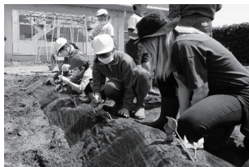
ファミリー班での サツマイモ苗植え