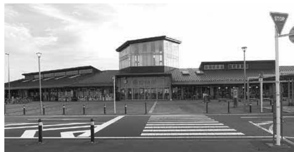
道の駅まくらがの里こが

答 答申内容は、将来の町の活性化のツールとして必要性を認め、前向きに検討を進めるが、町財政と将来世代への負担増にならないよう、機能と規模を含め経営に関する更なる検討を必須とするものでした。