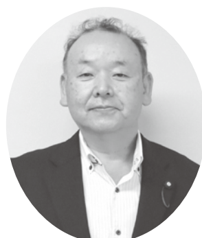
【副議長】 おり はら 折原 かつ お 勝夫