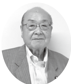
【議長】 ま せ 眞瀬 よし まさ 薫正