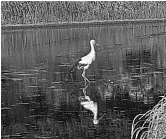
佐川野地区の水田に飛来したコウノトリ

答 地球温暖化対策、生物多様性の保全等様々な観点から、その必要性が高まっています。町ではグリーン農業推進協議会を発足し、先進地視察を実施したところです。また、有機農業者が実際に耕作している若林、佐川野、川田地区をモデル地区として、農水省より野木町特定区域の認定を受けているので、町の有機農業の拠点として有機農業の生産拡大を目指していきたいと思えます。