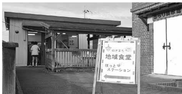
きらり館で開催されている地域食堂

答 今後、子ども会連合会の取組み方を考えていかなければならない時期に来ていると思えますので参考にします。