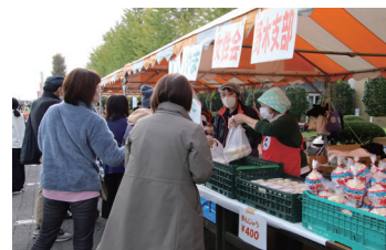
第45回野木町産業祭の様子