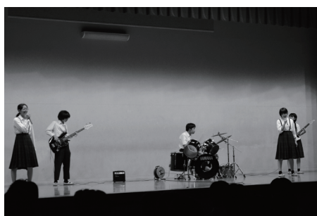
オンステージ(R6年度)